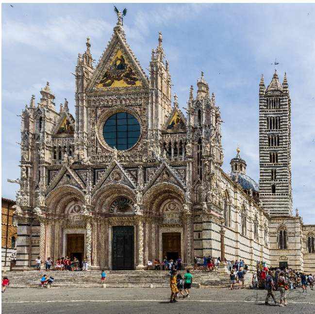
Siena Dom CCBYND2.0 SdosRemedios-at-flickr

Für kulinarische Erkundungen bietet sich das Gourmetkaufhaus EATALY in der Nähe Ihres Hotels an. Es ist bis spät in den Abend hinein geöffnet.