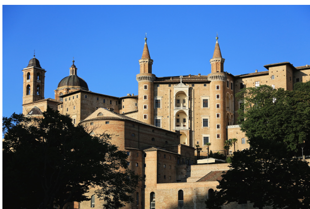
Urbino Palazzo Ducale

Mit einem letzten Blick auf Florenz von dem wunderschönen Giardino Bardini , mit seiner herrlich blühenden Glyzinien-Allee, nehmen Sie Abschied und fahren zur Ostküste in den Raum Pesaro. Zimmerbezug für 1 Übernachtung in einem modernen, von einem üppigen Garten umgebenen Hotel. Gemeinsames Abendessen im Hotel.