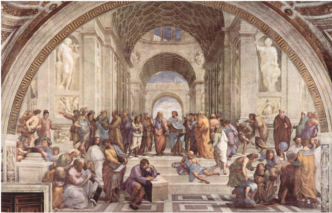
Vatikanische Museen_Schule von Athen_Raffael

Stimmen Sie sich bei einem gemeinsamen Abendessen im Hotel auf die kommenden Tage ein!