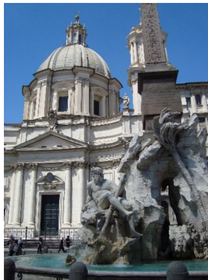
Rom Piazza Navona

Im Anschluss besuchen Sie die Raffael gewidmete Sonderausstellung in den Scuderie del Quirinale . Das Ausstellungsgebäude ist in der ehemaligen Wagenhalle und den Stallungen des Quirinalspalastes untergebracht und wird für große Kulturveranstaltungen genutzt. Der Palast selbst ist Amtssitz des Präsidenten der Republik Italien.