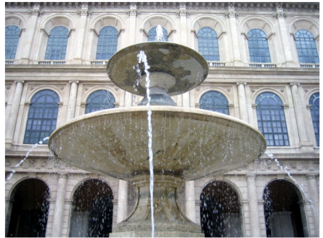
Palazzo Barberini

Am Nachmittag unternehmen Sie einen gemeinsamen Spaziergang durch die Altstadt Roms zur Piazza Navona . Der Vierströme-Brunnen in der Platzmitte, ein Werk Berninis, stellt die zur damaligen Zeit bekannten vier Erdteile dar. Der Abend steht für eigene Erkundungen zur freien Verfügung.