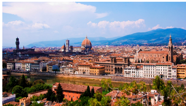
Florenz Blick von Piazzale Michelangelo

Im Anschluss fahren Sie weiter nach Florenz. Hotelbezug für 2 Übernachtungen. Gemeinsames Abendessen in einer Trattoria.