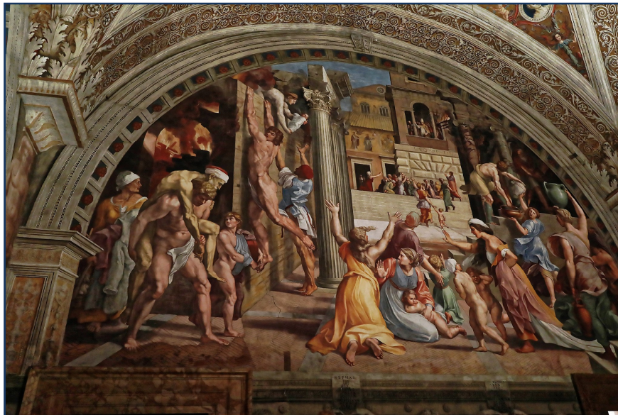
Vatikanische Museen-L'incendio di Borgo-Raffael CCBYSA4.0-Burkhard Mücke-at-Wikimedia Commons

Der Maler, Architekt und Poet Raffael (Raffaello Sanzio, 1483–1520) galt und gilt als einer der größten Meister der Renaissance-Kunst. 2020 jährt sich sein Todestag zum 500. Mal. Er verstarb mit nur 37 Jahren und hinterließ ein Erbe, das zu den bedeutendsten und nachhaltigsten der Kunstgeschichte zählt.